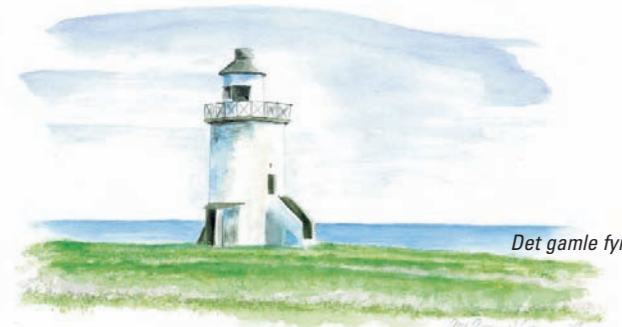
Det gamle fyr

7) Sejlkubbens hus: 1946 gav Lodsdirektoratet tilladelse til at Nakskov Sejlklub kunne opstille et hus og anlægge Sejlkubsbroen (8) .