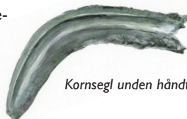
Kornsegl uden håndtag

Et andet vigtigt næringsmiddel i oldtiden var "hestebønne". Den er meget proteinholdig, kan tørres og opbevares i flere år. Oprindelig var navnet på planten "bønne", men efter at den såkaldte "havebønne" blev indført i 1600-tallet, mistede hestebønne sin betydning. Samtidig fik den det lidt flatterende navn "hestebønne".