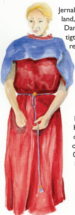
I jernalderen klædte man sig ofte i farvestrålende tøj

Jernalderen var oldtidens sidste og mest dynamiske periode. Danmark udviklede sig for alvor til et land, hvor man ikke kun levede af landbrug, men også af forskellige håndværk. I store dele af Danmark boede befolkningen tæt - landsby lå ved landsby. I disse landsbyer trivedes et levedygtigt landbrug, gerne baseret på et stort kvæghold. En ny klasse af storbønder var vokset frem og residerede i landsbyernes store høvdingegårde.