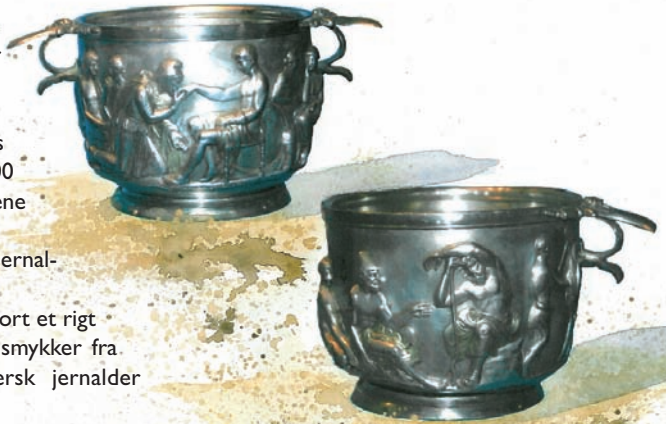
Sølvbægre fra Hobyfundet

Sidste del af jernalderen i Danmark er en lang bevægelse mod det vi kalder vikingetiden. Jernalderens og vikingetidens samfund og tro er nærmest uadskillelige og dog er der en forskel. De nordiske jernalderfolk synes at gå fra at være handelsfolk i eget land til at blive handelsfolk og sidst men ikke mindst krigere i hele den dengang kendte verden – med det er en ganske anden historie.