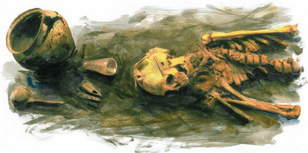
Kvindegrav fra Juellinge med fine gravgaver. Bronzekar, øse, saks samt glasbæger som vist ovenfor.

Der skal rettes en stor tak til de mange deltagende arrangører i Fjorddage 2005, der alle lægger et stort arbejde i at lave et flot arrangement. Vi ønsker alle arrangører og gæster gode oplevelser under Fjorddage 2005 - Fjorddage Styregruppen