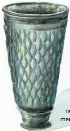
Glasbæger fra Juellingegraven