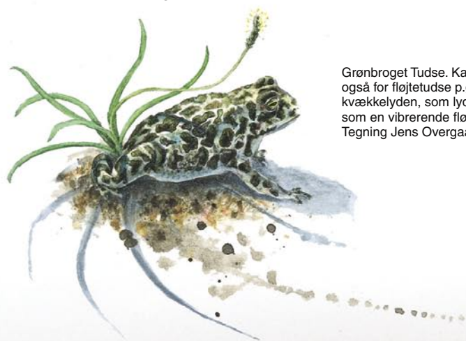
Grønbroget Tudse. Kaldes også for fløjtetudse p.g.a. kvækkelyden, som lyder som en vibrerende fløjtetone. Tegning Jens Overgaard

For at give bedre vilkår til padderne er de gamle vandhuller blevet oprenset og udgravet. På Enehøje har det især betydet forbedrede forhold for Strandtudse og Grønbroget Tudse. Udviklingen i paddebestanden følges løbende.