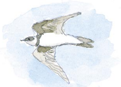
Digesvale. Yngler i skrænterne på vestsiden af øen. Tegning Kirstine Thoresen-Lassen

Fuglelivet er rigt og varieret p.g.a de mange forskellige naturtyper, der er på øen. Af karakteristiske fugle, som man kan møde på en tur rundt på øen kan nævnes: Strandskaden med sit lange røde næb, den farvestrålende Gravand, samt Digesvalen som lever i kolonier i skrænterne på øen. Strandsøerne på nordenden giver gode raste- og fødemuligheder for ænder og vadefugle. I isvintre går ræve over isen til Enehøje. Rævene er hårde ved de ynglende fugle, idet de æder æg og unger. Derfor bekæmpes rævene på Enehøje. På nord- og sydenden kan man finde mange strandplanter som Strandgåse-