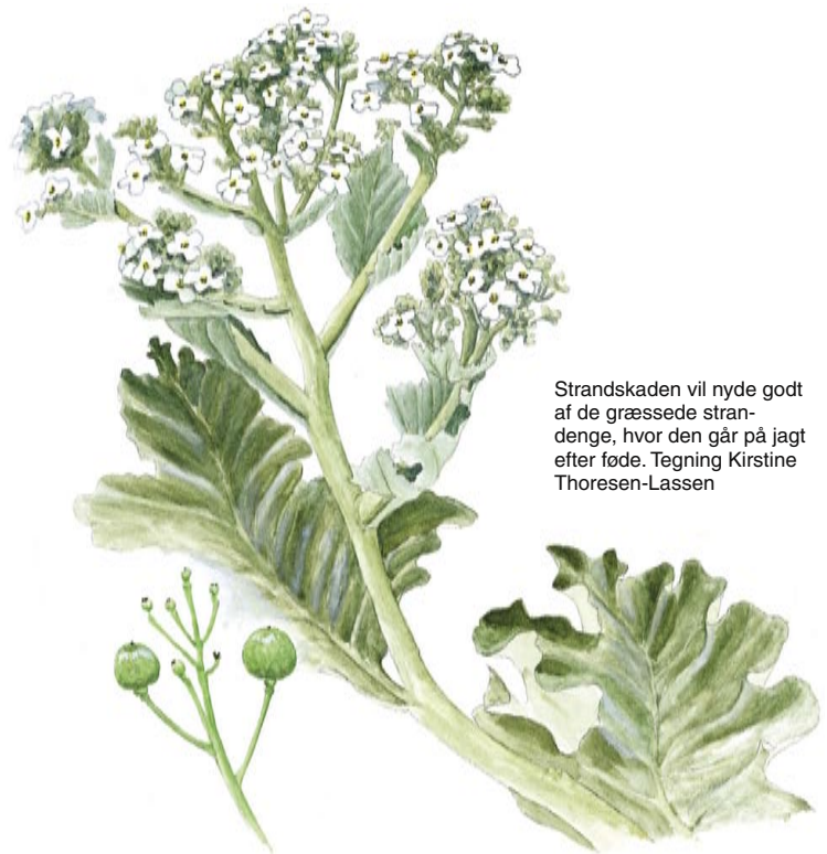
Strandskaden vil nyde godt af de græssede strandenge, hvor den går på jagt efter føde. Tegning Kirstine Thoresen-Lassen